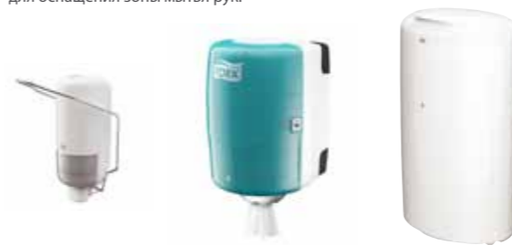
Диспенсер для жидкого мыла с локтевым приводом (S1)

Рекомендуемый ассортимент для оснащения зоны мытья рук: