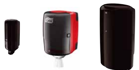
Диспенсер для жидкого мыла (S1)

Рекомендуемый ассортимент для оснащения зоны мытья рук: