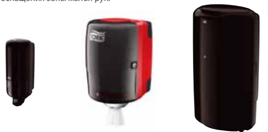
Диспенсер для жидкого мыла (S1)

Рекомендуемый ассортимент для оснащения зоны мытья рук: